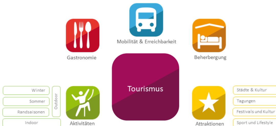
Abbildung 1 Wesentliche Komponenten eines touristischen Angebots.

Der Bericht und die vorliegende Zusammenfassung für Entscheidungstragende betrachten jeden der in Abbildung 1 dargestellten Bausteine des touristischen Angebots, beschreiben die jeweilige Betroffenheit durch den Klimawandel und mögliche Handlungsoptionen. Diese werden abschließend zu einem ganzheitlichen Konzept verknüpft.