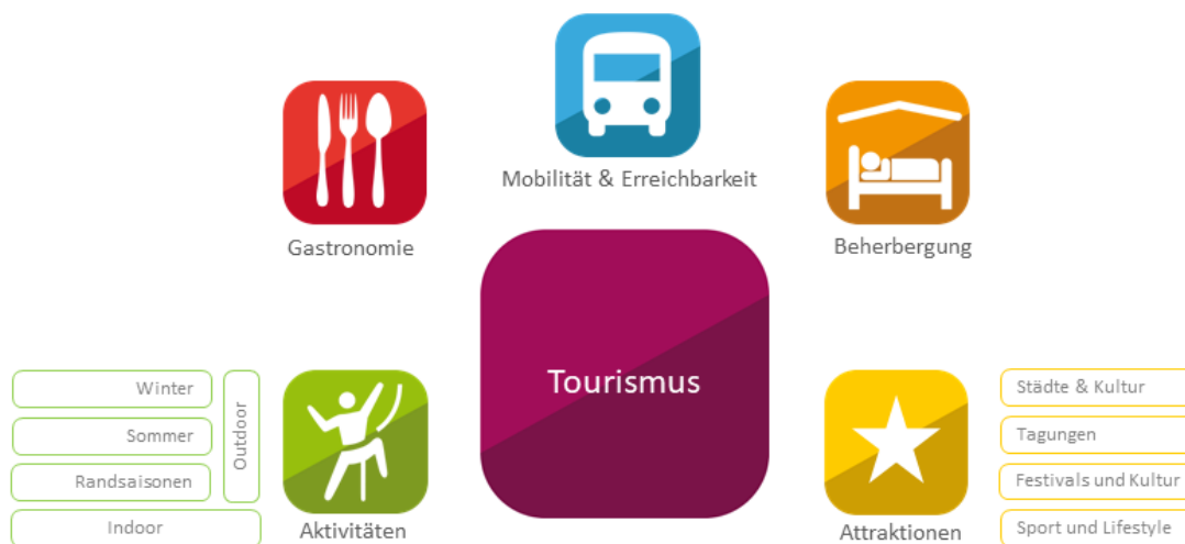
Abbildung 1 Wesentliche Komponenten eines touristischen Angebots.

Viele Bereiche der Landnutzung, wie etwa die Land- und Forstwirtschaft, sind von den Auswirkungen des Klimawandels betroffen. Der Tourismus unterscheidet sich von diesen betroffenen Bereichen ganz wesentlich. Zum einen setzt sich ein touristisches Angebot grundsätzlich aus verschiedenen Komponenten zusammen, die von verschiedenen Anbietern kommen und die in Österreich, anders als vielfach in Nordamerika, meist völlig unabhängig voneinander entwickelt und angeboten werden. Abbildung 1 gibt einen Überblick über diese Komponenten. Zum anderen unterscheiden sich die Verhältnisse gegenüber anderen Landnutzungen auch dadurch, dass der Tourismus von der Wahrnehmung der Urlaubsregion durch den Gast und dessen Entscheidung abhängig ist (vgl. Abb.2).